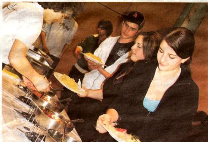
Spaghettiplausch war angesagt.